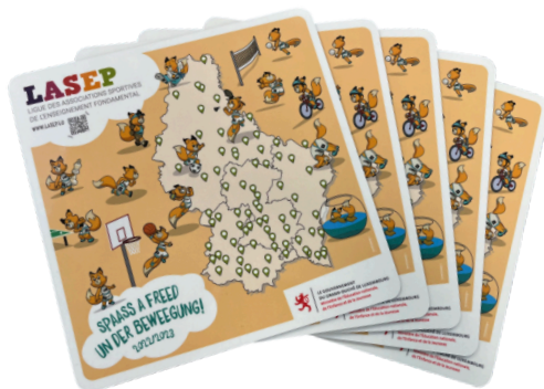
LASEP - Formation initiale LASEP | 25.03.2023